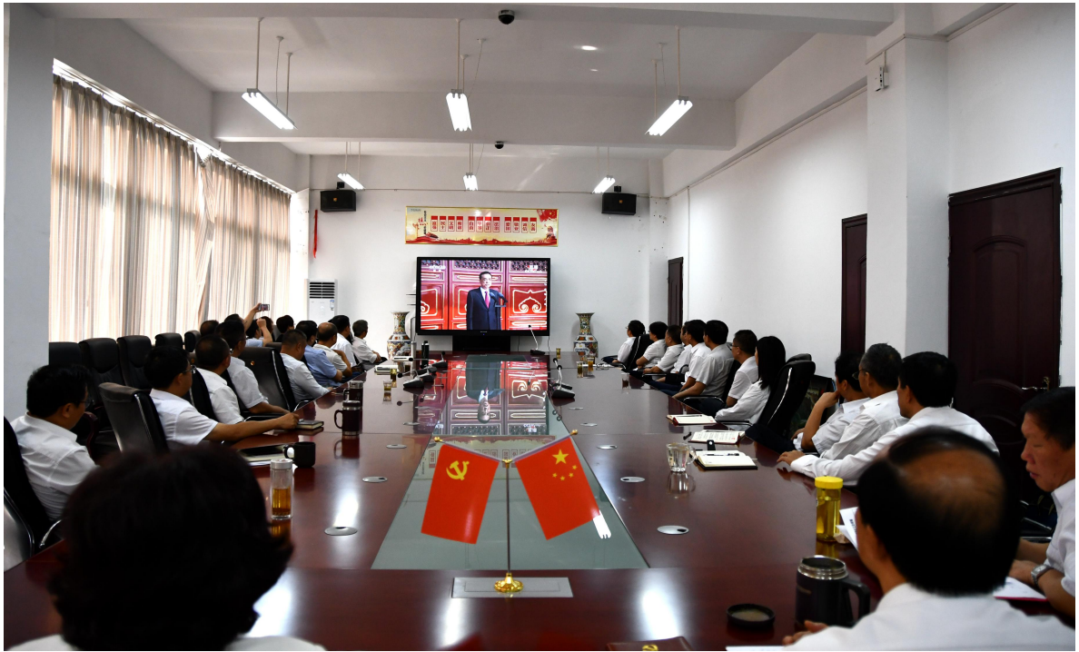
学院行政楼三楼会议室