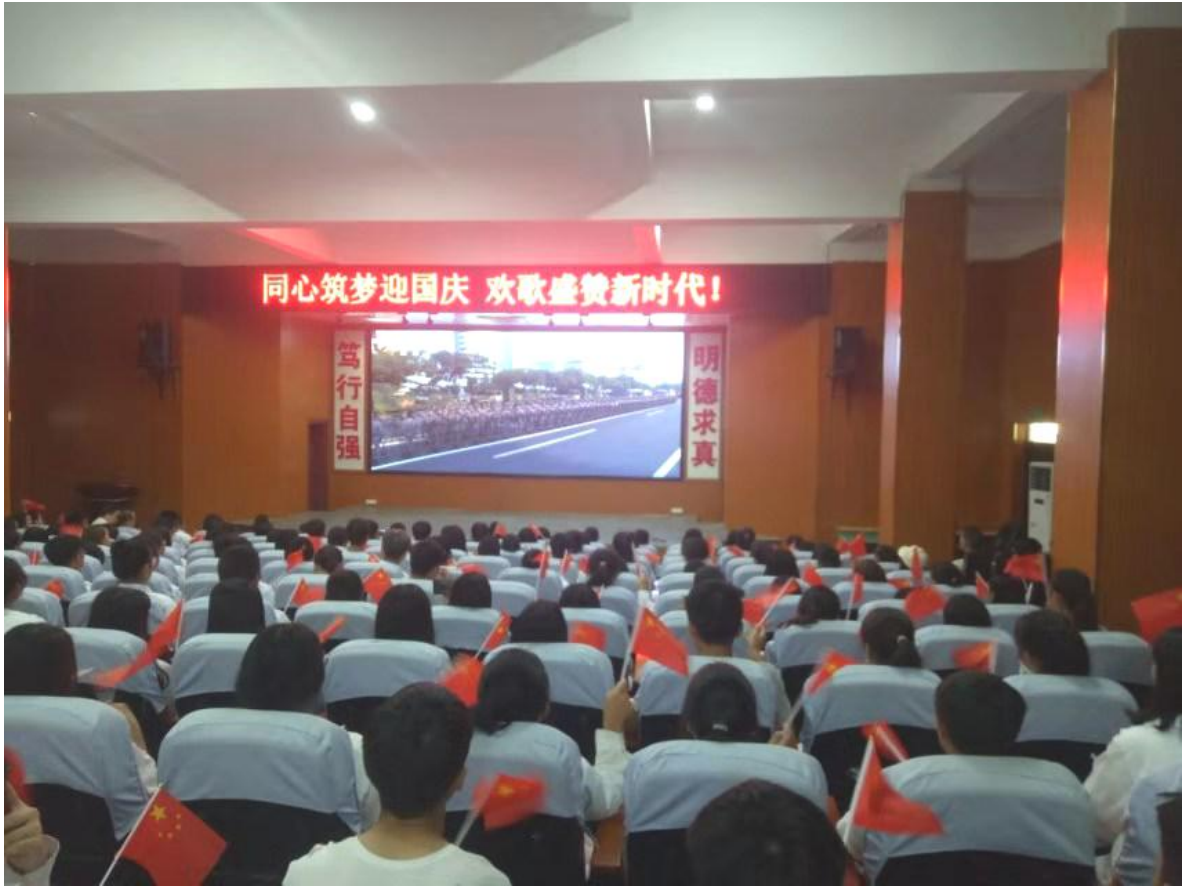
新校区寅亮厅组织学生收看