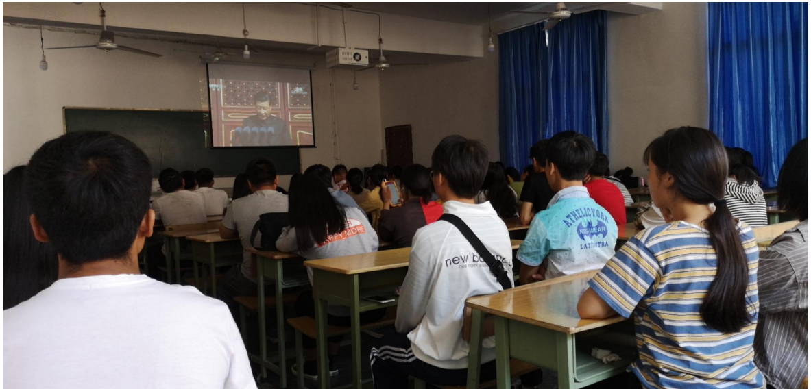
东关校区组织留校学生观看